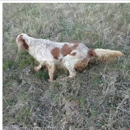
Allevamento della Fratticiola

2006-01-20 (F) LOI LO0670038 Couleur : BIANCO ARANCIO (lemon) fiche affixe