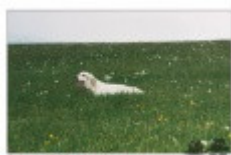
RADENTIS CRISS - 8 febbraio

RADENTIS CRISS 2000-06-30 (M) LOI LO0128798 - lemon