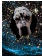
JADE DU GOURG D'ENFER 1994-05-19 (F) LOF 122811/22091 - tricolore