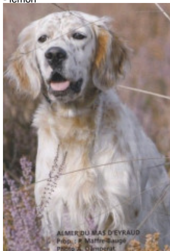
ALMER DU MAS D'EYRAUD Prop. : M. Marre-Sauge PBBig A. Clamperat

RADENTIS ZUM 2002-07-08 (M) LOI LO02161851 (Camp. Tr. (Ch GQ), Camp. Int. Lav., Camp. Ital. Lav.) - lemon